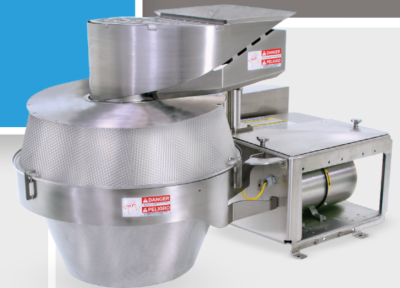
Neue CCLL Schneidemaschine

Eine neue Maschine ergänzt die berühmte Urschel-Serie Modell CC (Kartoffelschneidemaschine). Wenn Sie nach einer hochwertigen Schneidemaschine suchen, die Ihr Produktsortiment ergänzt, dann ist die CCLL (Chip Cutter Large Lattice) Schneidemaschine von Urschel genau das Richtige für Sie.