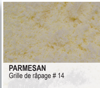
PARMESAN Grille de râpage # 14