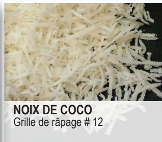
NOIX DE COCO Grille de râpage # 12