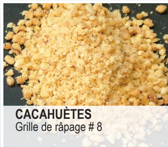
CACAHUËTES Grille de râpage # 8