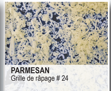
PARMESAN Grille de râpage # 24