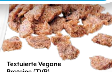
Texturierte Vegane Proteine (TVP) Comitrol Processor