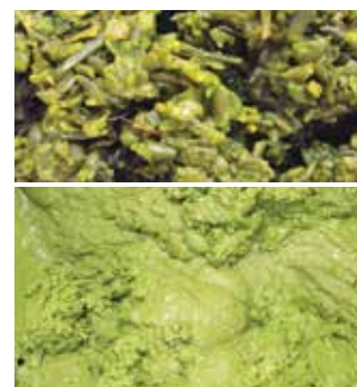
Seegras Püree, Comitrol Processor