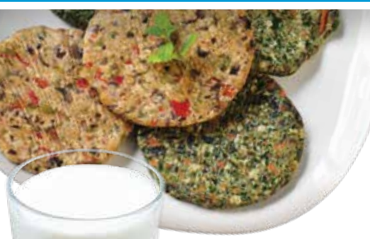
Bestandteile für vegetarische Burger Comitrol Processor