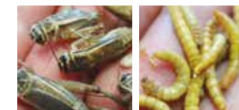
Insekten Paste, Comitrol Processor