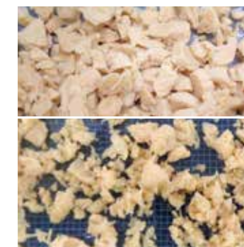
Extrudiertes Erbsenprotein Comitrol Processor