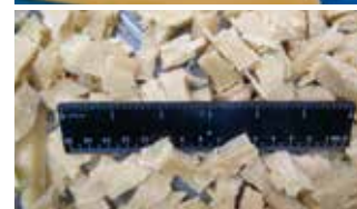
Soja-/Erbsenprotein, Fleischimitat 12,8 mm (1/2") Würfel M6 Würfelschneidemaschine