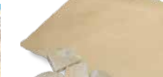
Soja/Erbsen Protein, Fleischimitat 38,1 x 25,4 mm (1-1/2 x 1") M6 Würfelschneidemaschine