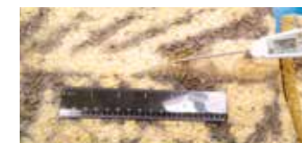
Proteinplatten auf Sojabasis 19,1 mm (3/4") Würfel M6 Würfelschneidemaschine