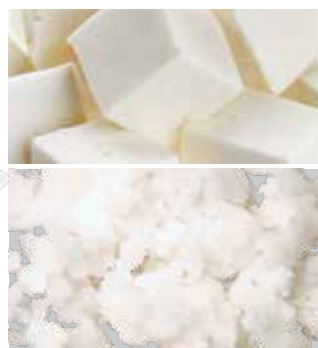
Gefrorenes Kokosnussöl Emulgiert, Comitrol Processor

Urschel liefert solide gebaute, qualitativ hochwertige Maschinen. Von kleinen zu großen Würfeln, Scheiben, Streifen- und Zerrupfschnitten und weiteren Schnittgrößen decken wir viele Anwendungsbereiche ab. Alternative Proteine sind in vielen Produkteigenschaften einzigartig, der Viskosität, dem Feuchtigkeitsgehalt, den Anforderungen bezüglich der Verarbeitungstemperatur, Größe, Form und vieler weiterer Eigenschaften. Urschel kennt diese Faktoren und findet die ideale Schneidlösung für Ihre Anforderungen.