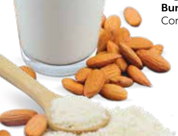
Mandeln Milch & Mehl Comitrol Processor