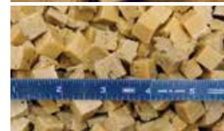
Fischimitat auf Sojabasis 12,8 mm (1/2") Würfel, Sprint 2 Würfelschneidemaschine