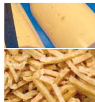
Soja-/Erbsenprotein, gepresst 3,2 mm (1/8") Streifenschnitt DiversaCut 2110A Würfelschneidemaschine