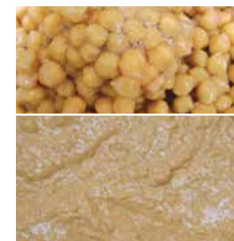
Kichererbsen Paste, Comitrol Processor