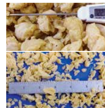
Extrudiertes Erbsenprotein 6,4 mm (1/4") Zerrupfschnitt Sprint 2 Würfelschneidemaschine