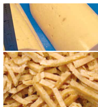
蛋白肠 1/8" (3.2 mm)切条 DiversaCut 2110A切丁机