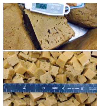
黄豆基蛋白 1/2" (12.8 mm) 切丁, Sprint 2切丁机