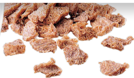
组织性植物蛋白 Comitrol系列

凭着尤索精湛的切割技术，能有效地为日益多样化的人造蛋白提供有针对性的切割解决方案。