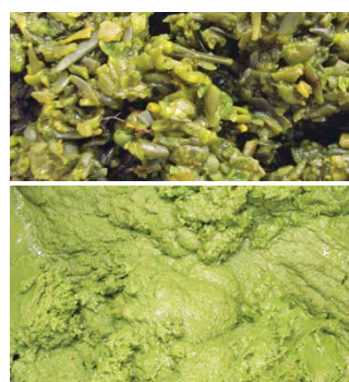
海藻 海藻泥, Comitrol系列