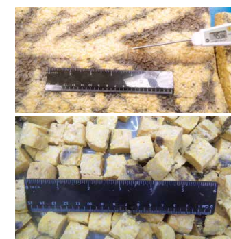
黄豆基蛋白大块 3/4" (19.1 mm) 切丁, M6切丁机