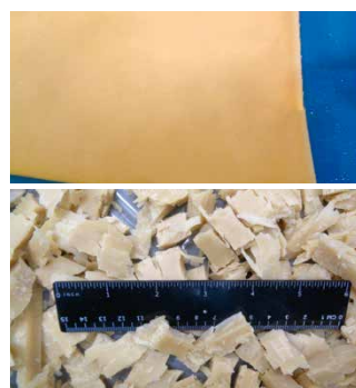
人造肉板 1/2"切丁, M6切丁机