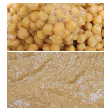
鹰嘴豆 泥状, Comitrol系列