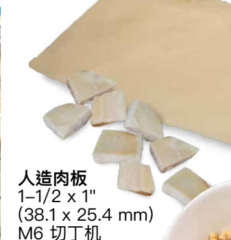
人造肉板 1-1/2 x 1" (38.1 x 25.4 mm) M6 切丁机