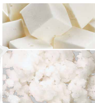
冷冻椰子油 细磨, Comitrol系列