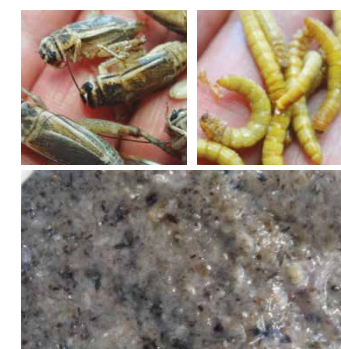
昆虫 泥状, Comitrol系列