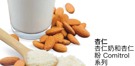
杏仁 杏仁奶和杏仁粉 Comitrol系列