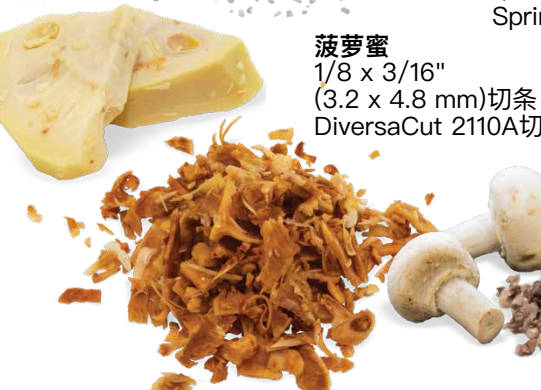
菠萝蜜 1/8 x 3/16" (3.2 x 4.8 mm)切条 DiversaCut 2110A切丁机