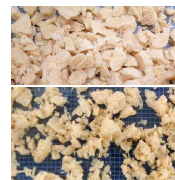
豌豆基蛋白粗磨 Comitrol系列