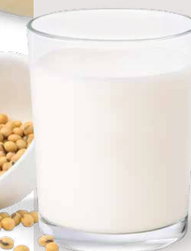
黄豆 豆奶 Comitrol系列