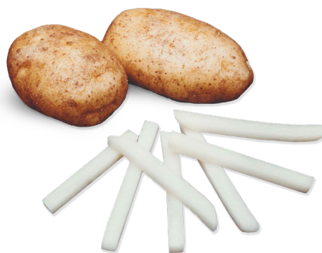
POMMES DE TERRE Bâtonnet de 7,4 mm

Une large gamme de dimensions de coupe est disponible pour répondre aux exigences de votre produit.